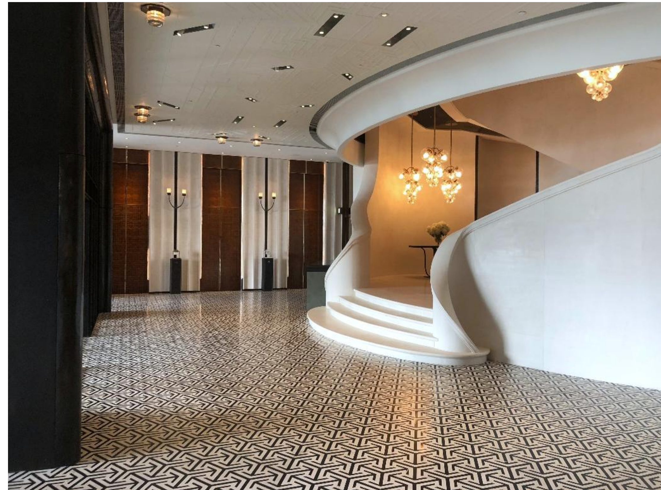
宴會大堂入口（二樓）& 通往宴會大禮堂（三樓）的大理石樓梯